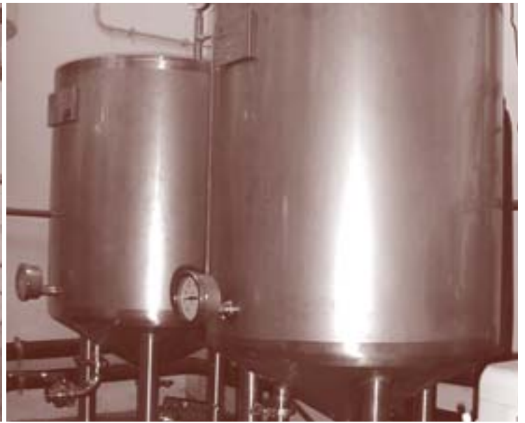
Impianto pilota per la produzione di birra dell'Università degli Studi di Udine